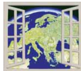
Una finestra sull'Europa

Università e lavoro: un matrimonio impossibile?